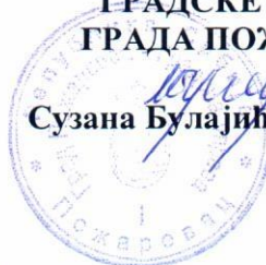
Сузана Булајић, дипл. правник