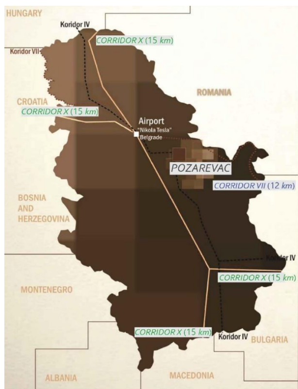
Мапа 1: Географски положај града Пожаревца

Повољан геостратешки положај доприноси томе да Град Пожаревац представља административни, културно-образовни, здравствени, саобраћајни и привредни центар Браничевског округа.